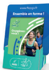
» Présentoirs flyers A5 à poser sur votre table d'accueil lors de votre forum.