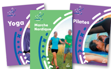
» Flyers de pratiques Marche nordique, Yoga, Pilates