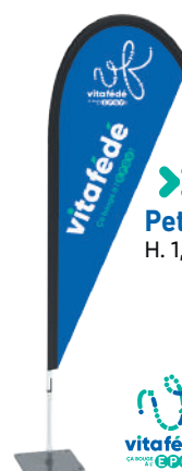
» Petite voile H. 1,40 m