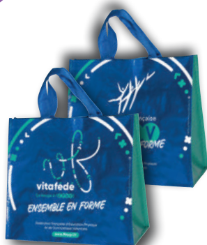
» Sac cabas course Version FFEPGV

En raison de la transmission à Gévédit du nombre de points alloués à chaque association à la clôture de la base de données fédérale au 31 juillet et de la fermeture estivale des stocks Gévédit (stocks gérés dans une entreprise adaptée), votre commande coopérative sera traitée prioritairement à la réouverture de la logistique à partir du mardi 16 août 2023.